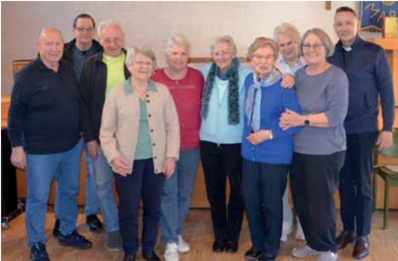
Dies sind die anwesenden NBH-Mitglieder am Krankengottesdienst-Nachmittag.

Die Nachbarschaftshilfe freut sich über den regen Besuch der beiden Veranstaltungen und bedankt sich recht herzlich. Es war sehr schön, das gute Miteinander an beiden Tagen zu erleben.